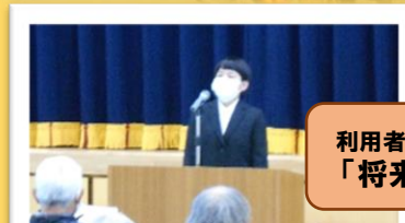
利用者作文発表 「将来の夢」