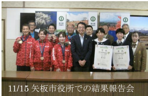
11/15 矢板市役所での結果報告会