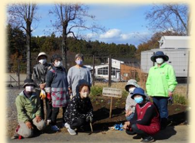
更生保護女性会の皆様

今回は、除草作業の他、冬・春にむけて、花壇にチューリップ球根とビオラの植え付けを行っていただきました。 いつもキレイにさせていただきありがとうございます 🌸