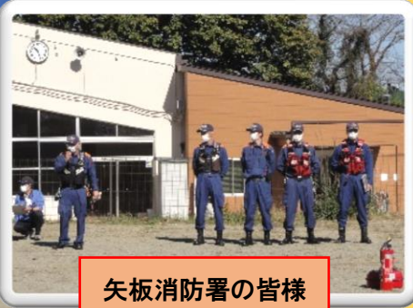
矢板消防署の皆様

今年は、地域の方々にもご協力いただき、避難訓練の様子を見てもらいました。ありがとうございました。