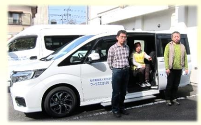
車両贈呈式の様子

3月24日、ALSOK(北関東総合警備保障株式会社)様より、ワークスたかはらへの新車(ステップワゴン)寄贈がありました。寄贈に関しては毎回全国で厳しい審査があり、挑戦3回目の応募で受贈できました。ワークスでの送迎時は勿論ですが、外出活動や清掃作業時にも大活躍中です。