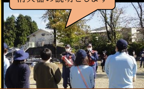
消火器の説明をします

今年は、地域の方々にもご協力いただき、避難訓練の様子を見てもらいました。ありがとうございました。