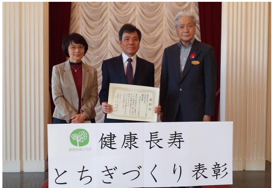
次長 理事長 福田富一県知事

「2022年度健康長寿とちぎづくり表彰」健康経営部門優秀賞を受賞し、 栃木県庁昭和館において表彰式が行われました。(R4.10.20)